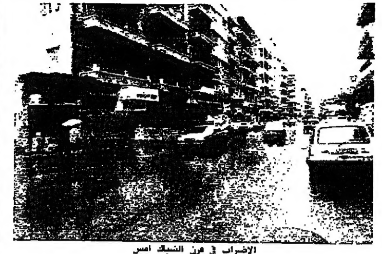
الاضراب في من الشمال اسس

باسم التضامن مع الشمال، نفذ اسس في المناطق الشرقية وبعض مناطق الشمال التي لبت الدعوة عبر الاقليم في بعض القرى الساحلية على رغم الدوريات السورية التي جلبت المناطق لفتح الحملات من اقلها ابوابها في المناسبات. اصدرت فاعليات بيانات تأسد نعت امالي الشمال الى اطلاق صرخة الحرية اللجان الطلابية المسيحية اصدرت بيانا جاء فيه يا شعبنا الصمد في الشمال نندمك اليوم. لنصل اليك صرخات الحرية محملة بشوق الفناء نندمك اليوم لنسعدوا صدى حرية ما تعودت ان تكون لقم من هذا الشعب دون الاخر. يا شعبنا في الشمال، ليست المرة الاولى التي نعاني فيها من خطر الوجود. ومن يجيد قراءة التاريخ يعي تماما ما نحن قائلون. نتلايكم للحرية في هذا اليوم قلم رفاق لكم ونهيب من اعلمكم لتدبوا الوجع في زرع الرب في مواقع حواجزنا الخلقين. حيث قامت مجموعات حركة لبنان الواحد بسلسلة من المواجهات مع قوات النظام السوري وعملاته في طرابلس، وعكس والكورة. كان من نتيجتها زرع الرب والخوف والانفصال في صفوف المحتلين وعملاتهم وضغطهم في تفاصيل هذه المواجهات في بيان لاحق على الطريق الطويل نحن نتمنى ونحن نتمنى هذا والقتال الكورني ان يحور جسر المدفون شهد قبلة ظهر اسس اشتباكات عنيفة بين الجيشين اللبناني والسوري. وسقطت قذائف المدفعية بعيدا عن خط المواجهة لجهة قري ومدن ساحل جبيل. بعد سلسلة من الممارسات للقوات السورية منذ الصباح عند الحاجز على الجسر المذكور. واقتات ان هذه الاشتباكات جاءت في الوقت الذي شهد فيه مناطق البيرون